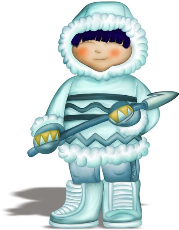
Eskimos - Grenlandia