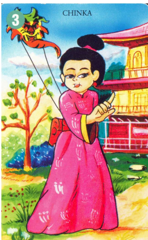
Chinka - Chiny