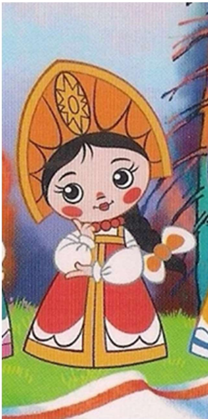
Rosjanka - Rosja